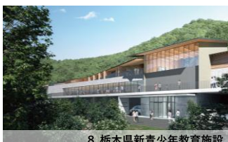
8.栃木県新青少年教育施設