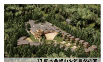
13.熊本金峰山少年自然の家