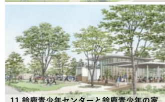
11.鈴鹿青少年センターと鈴鹿青少年の家