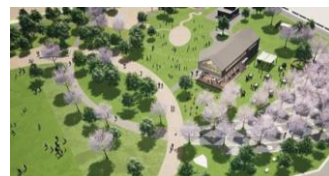
7.都立晴海ふ頭公園